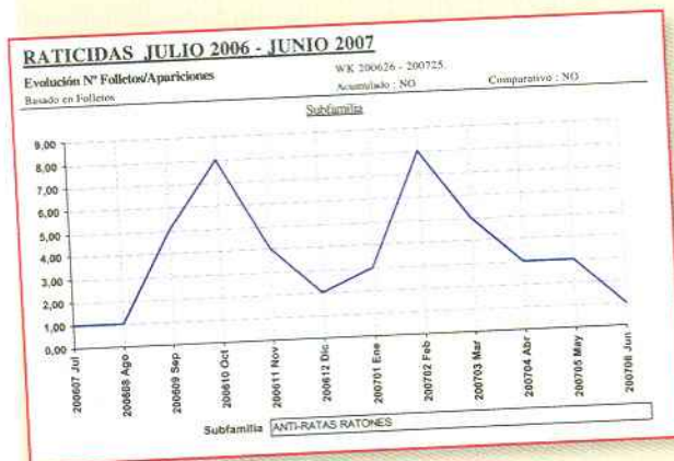
IDP: Índice de Presencia.

con un 21,35% de IDP y un total de 10 apariciones de raticidas en sus folletos, seguido de su filial Gadisa Haley (con un IDP15, 41% y 9 inserciones) y La Cadena 88 (14,11% de IDP). Respecto a la evolución por meses, las inserciones de raticidas en los folletos alcanzaron su cota máxima en octubre de 2006 y febrero de 2007, produciéndose brascas caídas en los meses siguientes.